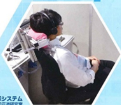
温冷感提示システム 坂口正道研究室